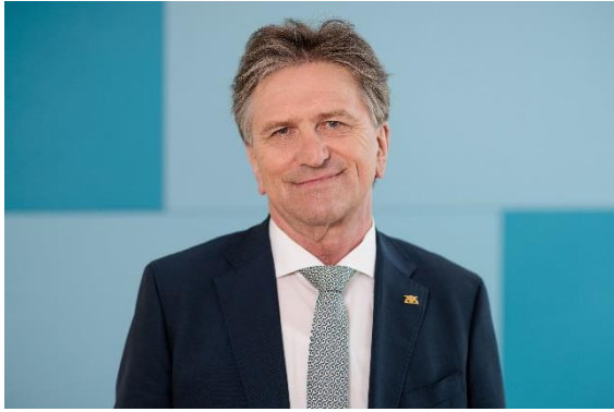
Minister Manne Lucha